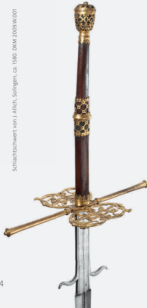
Schlachtschwert von J. Allich, Solingen, ca. 1580. DKM 2009.W.001