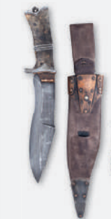
Schlünder, Rafael (DE)