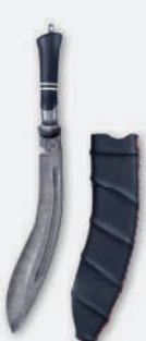
Winkler-Hermaden, Wolfgang (AT)

STIFTUNG FREUNDE DES DEUTSCHEN KLINGEN MUSEUMS SOLINGEN